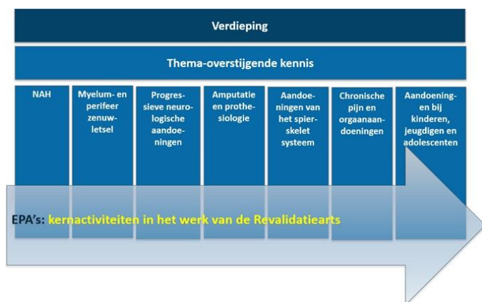
Figuur 2. Samenhang tussen EPA's en medisch inhoudelijke thema's.

De regionale afspraken met betrekking tot volgen, monitoren en bekwaam verklaren staan beschreven in het ROP. Het beoordelen in de opleiding revalidatiegeneeskunde is erop gericht om stapsgewijs meer verantwoordelijkheid in de patiëntenzorg toe te kennen aan aiossen. De groei van de aios is terug te vinden in het verkrijgen van bekwaam verklaringen op de verschillende EPA's, waarmee de opleidingsgroep aangeeft een bepaalde activiteit toe te vertrouwen aan de aios. De EPA's die geheel of op onderdelen te verkrijgen zijn in het LUMC staan beschreven bij de stagebeschrijvingen. Daarnaast worden in het LUMC de generieke activiteiten en de verdiepingsstage beoordeeld. De beoordeling van kennis, taken en competenties in de zeven medisch inhoudelijke thema's en overstijgende kennis zijn onderdeel van de beoordeling (Figuur 2, overgenomen uit landelijk opleidingsplan). Voor beoordeling van de theoretische kennis nemen alle aiossen tevens deel aan een Europees examen ten minste in het vierde jaar. Beoordelingsmomenten zijn gekoppeld aan de voortgangsgesprekken.